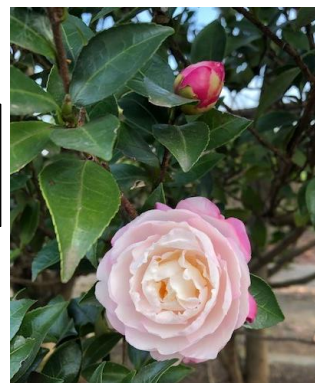
寒さに負けない寒椿

配信する機材の性能は高くありません。また、不慣れな部分もあります。ご了承ください。