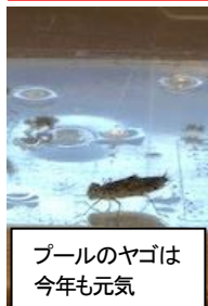
プールのヤゴは今年も元気

学校での調査開始 → 【連絡を受けた時点(結果が出る前)】からスタートするため、クラスターの範囲を縮小する効果が期待できます。