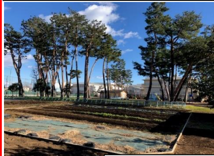
農場から見た校舎